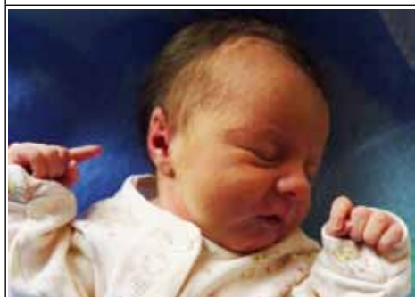
Córka Marty z Naklina