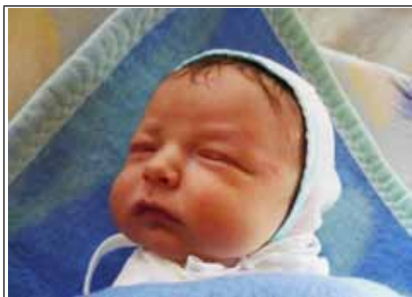
Syn Justyny z Woli Potockiej