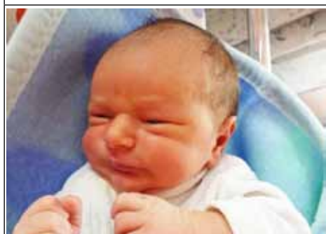
Syn Agnieszki z Lady