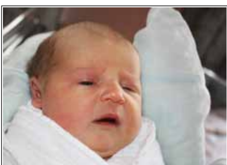
Córka Barbary z Ujścia