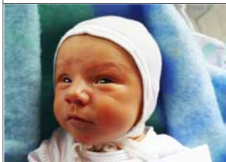
Syn Joanny z Chrzanowa Pierwszego