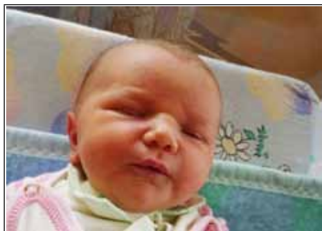
Córka Edwardy z Chrzanowa Kolonia