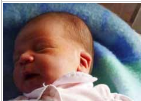
Syn Patrycji z Władysławowa