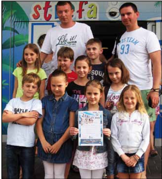
Regularne uprawianie pływania ma niemal same zalety. Poprawi nasze samopoczucie, poprawi sylwetkę, zwiększy

wydolność i wentylację płuc. Dodatkowo pomoże w rehabilitacji po przebytych urazach, a jest także dobrą metodą na odchudzanie. Nawet proste pływanie, tym czym potrafimy, ale regularne, pomoże w problemach z kręgosłupem, poprawi przemianę materii, zrelaksuje. Stowarzyszenie Kultury Fizycznej „ESKA” działa od września 2011 roku. Poza nauką pływania (na zajęcia uczęszcza 40 dzieci w wieku 7-11 lat) zajmuje się również piłką siatkową – klub „ESKA” (występujący w III lidze siatkarskiej).