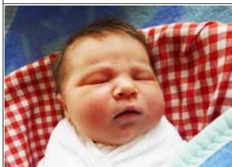
Córka Angeliki z Białej Drugiej