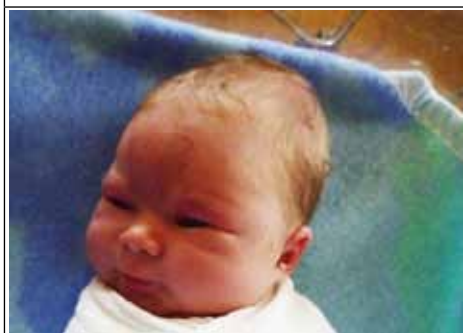
Córka Róży z Aleksandrówki