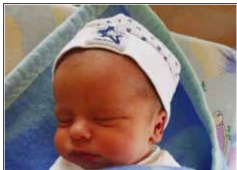
Syn Sylwi z Janowa Lubelskiego