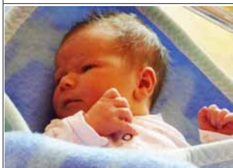
Syn Karoliny z Zagród