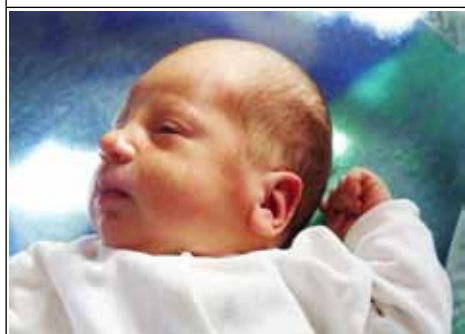
Syn Katarzyny z Godziszowa Pierwszego