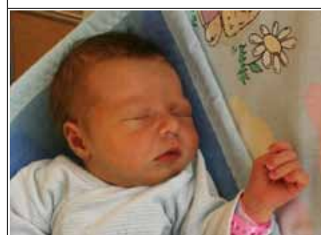
Córka Dominiki z Chrznowa Trzeciego