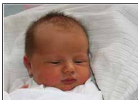
Córka Barbary z Godziszowa Drugiego