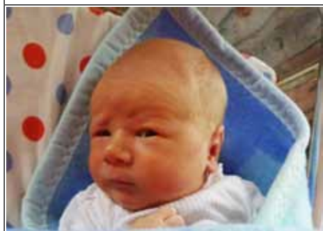
Syn Agnieszki z Janowa Lubelskiego