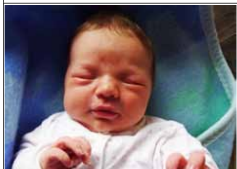
Syn Andżeliki z Janowa Lubelskiego