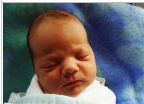
Syn Agaty z Węglinka