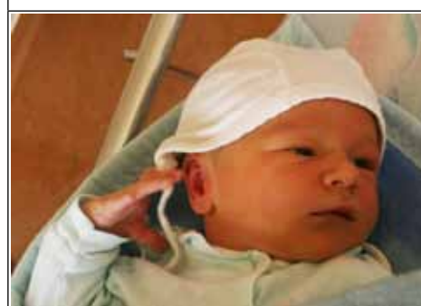
Syn Justyny z Dzwoli