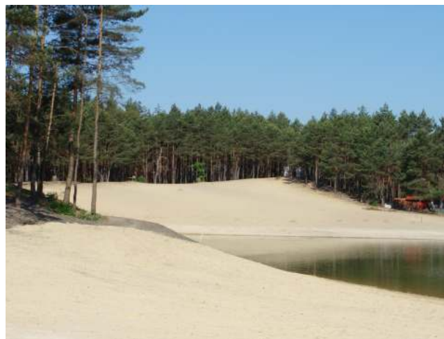
Widok z nowej plaży przy grobli

Wiceprezes Spółki „Zalew” Andrzej Majkowski