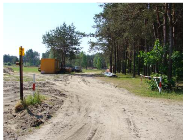
Droga doprowadzająca do starego kąpieliska i punktów gastronomicznych