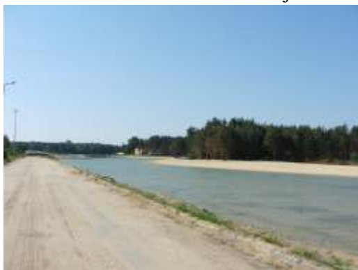
Droga od kapliczki przy ul. Wierdzowej prowadząca do zalewu - w przyszłości będzie zlikwidowana, nowe kąpielisko zostanie poszerzone