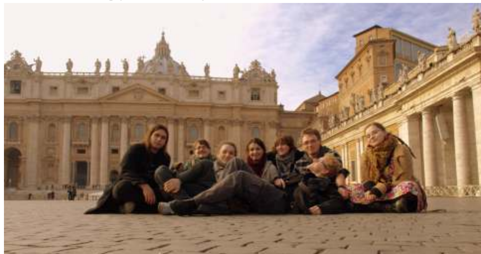
Plac św. Piotra

- Mateusz, gdzie jesteś? (W gwoździu ci, Czesiek, ma na imię Mateusz) zapytała zdenerwowana mama - pojechała na kilka godzin