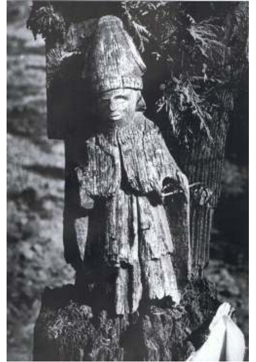
w. Mikołaj, Zdziłowice