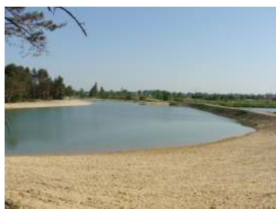
Nowa plaża przy grobli prowadzącej do wyspy