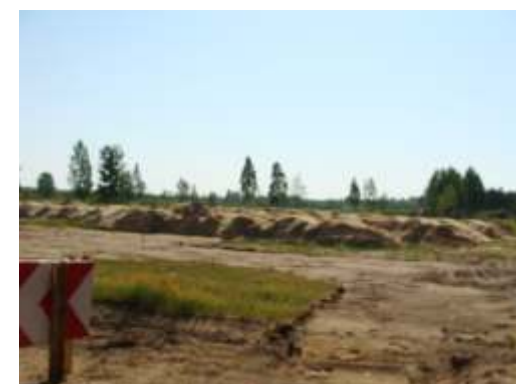
Parking przy drodze do starego kąpieliska