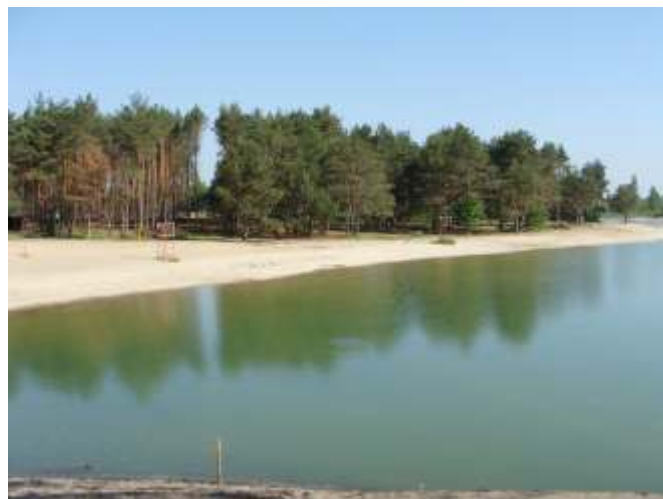
Stare kąpielisko - tu można się kąpać