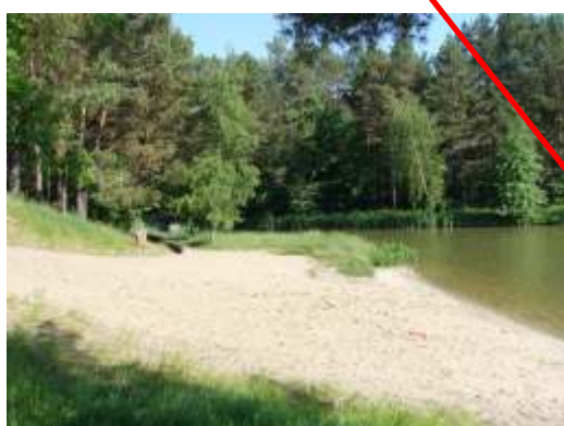
Brzeg pomiędzy obecnym posterunkiem policji a mostem prowadzącym na wyspę - tu powstanie przystań wodna (poza wizualizacją)