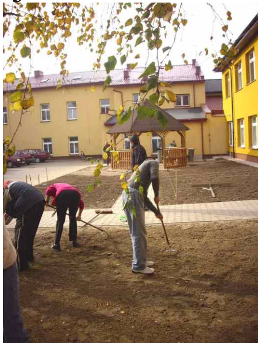
parkingu. Wszystkich chętnych zapraszamy do obejrzenia.

W ramach realizacji projektu systemowego Integracja i wsparcie osób i rodzin zagrożonych wykluczeniem społecznym z terenu powiatu janowskiego poprzez tworzenie nowych form wsparcia indywidualnego i środowiskowego Powiatowe Centrum Pomocy Rodzinie w Janowie Lubelskim zorganizowało warsztaty ogrodnicze dla 15 uczestników Środowiskowego Domu Samopomocy. Uczestnictwo w w/w warsztatach przyczyniło się do wzbogacenia wiedzy i zdobycia doświadczenia w przygotowaniu ogrodu. Osoby uczestniczące zostały zapoznane z komponowaniem elementów małej architektury ogrodowej, tj. altanki, ogrodzenia, ławeczek. Poznały techniki i zasady sadzenia roślin w ogródku, poznały zasady zakładania i pielęgnacji trawnika. Końcowym efektem warsztatu było wykorzystanie zdobytej wiedzy w praktyce, czego efektem jest pięknie zagospodarowany ogród, znajdujący się na placu budynków PCPR i ŚDS przy ulicy Zamoyskiego 37 od strony