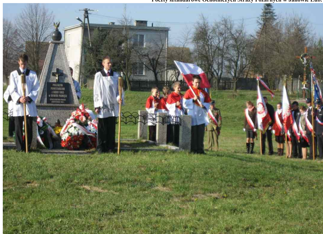
Święto Niepodległości w Gminie Potok Wielki