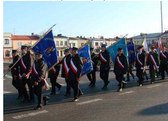
Poczty sztandarowe Ochotniczych Straży Pożarnych w Janowie Lub.