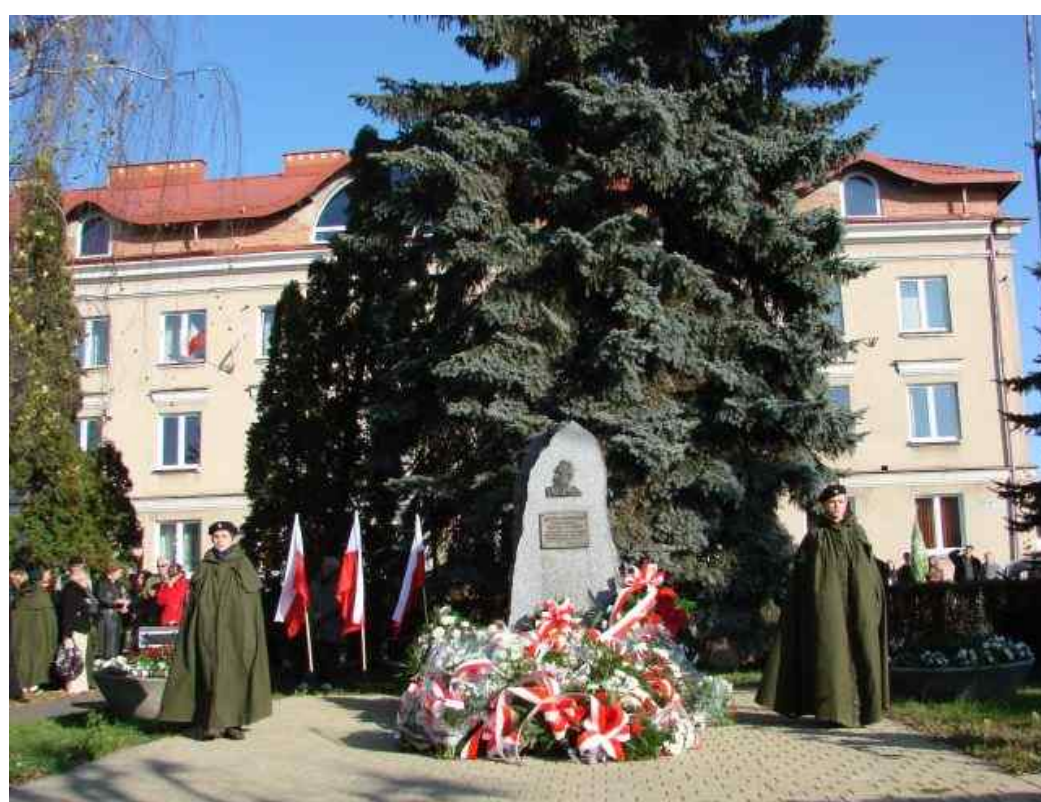
Uroczystości przed pomnikiem Józefa Piłsudskiego w Janowie Lubelskim