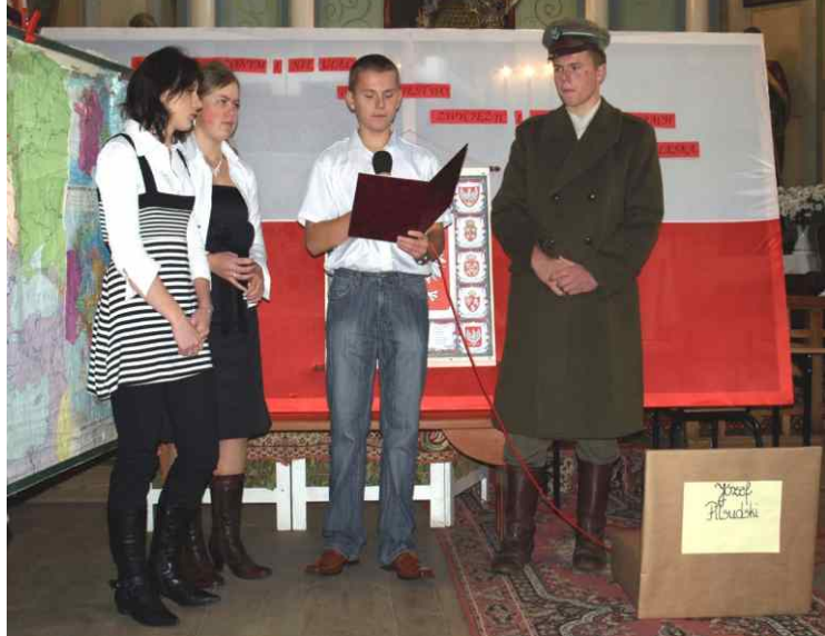
Święto Niepodległości w Gminie Chrzanów - akademia w Zespole Szkół w Chrzanowie

Narodowe Święto Niepodległości jest najważniejszym polskim świętem narodowym, obchodzonym 11 listopada, na pamiątkę odzyskania przez Polskę niepodległości w 1918r.