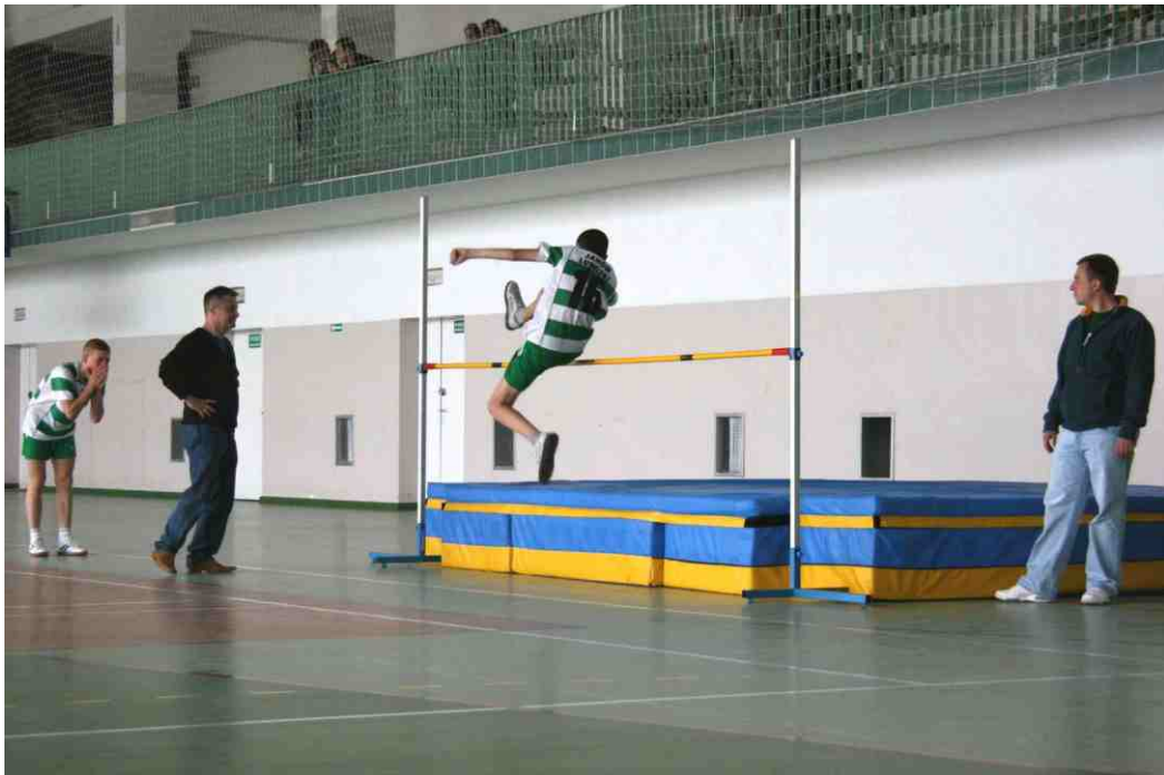
Uczniowie z PSP Janów Lubelski w trakcie walki o pierwsze miejsce

wymagały od młodych zawodników dobrego przygotowania kondycyjnego i technicznego. Walka była zacięta, na trybunach nie brakowało emocji. Zawody wygrali gospodarze - drużyny dziewcząt i chłopców z Publicznej Szkoły Po ds ta wo we j w Ja no wi e Lu be ls ki m.