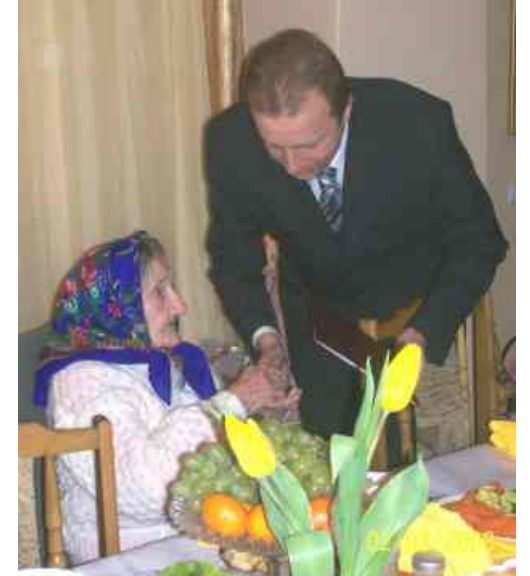
Burmistrz Janowa Lubelskiego składa życzenia jubilatce ciemne pieczywo. My ze swojej strony gratulujemy solenizantce i życzymy kolejnych stu lat życia.

okularów. Według niej, receptą na długowieczność jest obcowanie z przyrodą, przebywanie na świeżym powietrzu, praca i co najważniejsze odpowiednia dieta: nabiał, kozie mleko, sery,