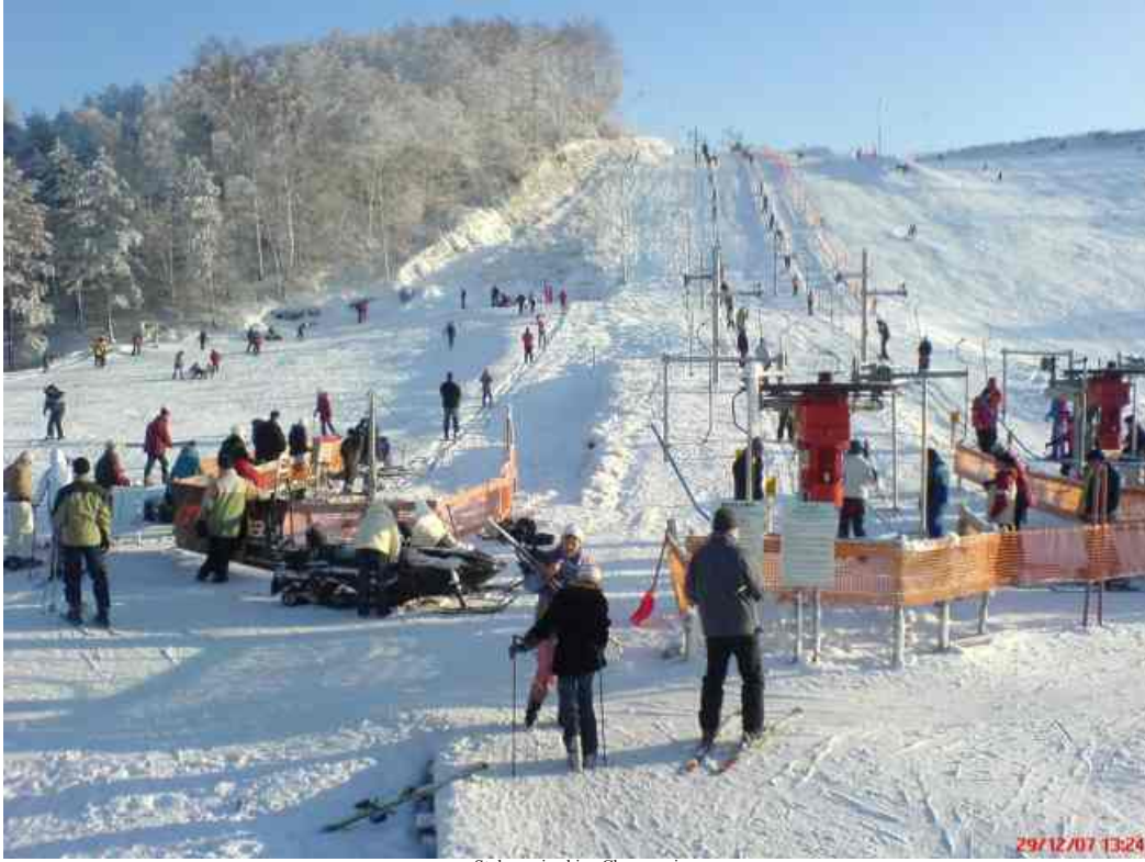
Stok narciarski w Chrzanowie

Jestem zaskoczony faktem, że dyrekcje oraz pedagodzy szkół z terenu powiatu janowskiego nie przejawiają inicjatywy zorganizowania uczniom wypoczynku oraz nauki jazdy na nartach w Chrzanowie. Krótki sezon nie przeszkodził grupom dzieci i młodzieży z powiatu biłgorajskiego, Zamościa, Lublina, mimo znacznych odległości, miło spędzić czas na stoku. Z terenu powiatu janowskiego, poza grupami uczniów ze szkół w: Chrzanowie, Otroczcu i Potoku Stanach, żadna szkoła nie była zainteresowana wyjazdem na stok - uważam, że tak być nie powinno.