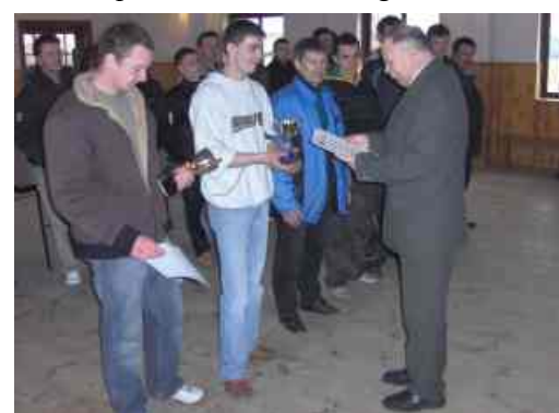
Zdobywcy pierwszych miejsc