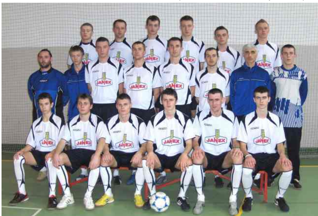
Kadra Janowianki przygotowuje się do trudnych spotkań rundy wiosennej.