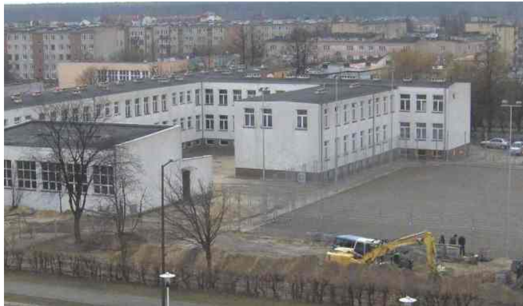
Gimnazjum - widok z dachu krytej pływalni

wyłożone zostaną kostką brukową. Odbiór całości robót przewidziany jest na koniec lipca. Całkowity koszt zamknie się kwotą 1 398 338 zł. Ze środków unijnych otrzymaliśmy 75% sumy 10% pochodzi z budżetu państwa pozostałe 15% pokryte zostanie ze