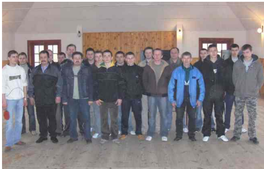
Wszyscy uczestnicy turnieju

Stoły dla poszczególnych jednostek zostały zakupione przez UM z funduszy przeciwalkoholowych. Na zakończenie