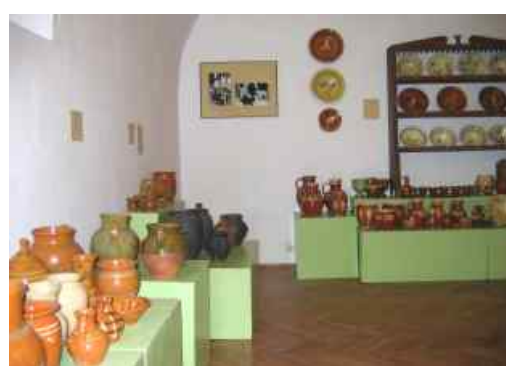
Fragment wystawy „Lubelska ceramika ludowa”

Bogactwo i różnorodność ceramiki ludowej pochodzącej z terenu Lubelszczyzny prezentuje wystawa pt. „Lubelska ceramika ludowa” zorganizowana w Muzeum Regionalnym z okazji tegorocznych Ogólnopolskich Spotkań Garncarskich. Wystawa składa się ze