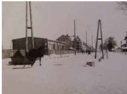
Okolice szpitala przed 1939 r