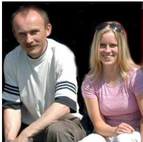
Autor z Laureatką